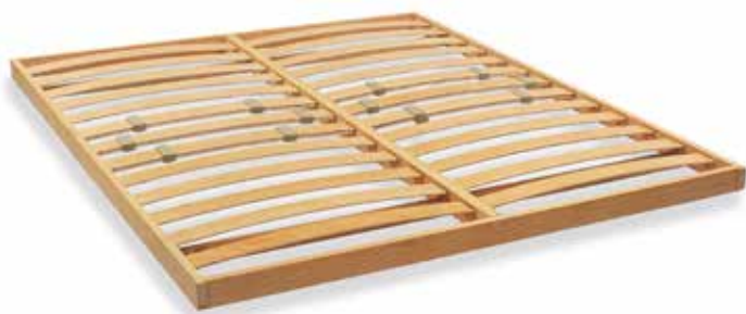
ART. 23 RETE IN APPOGGIO INTERAMENTE IN LEGNO