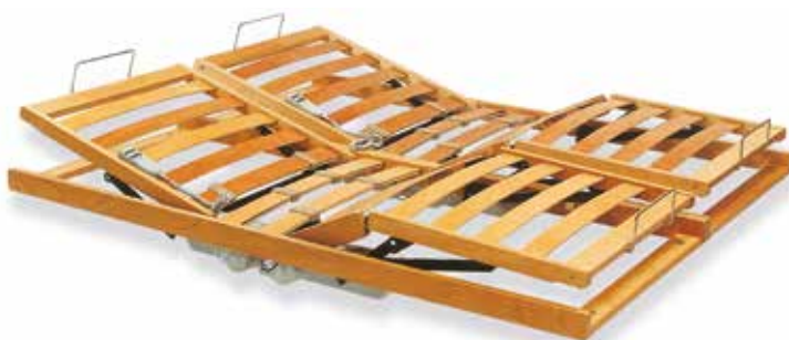
ART. 27 RETE IN APPOGGIO INTERAMENTE IN LEGNO CON MOTORE E ALZATE INDIPENDENTI