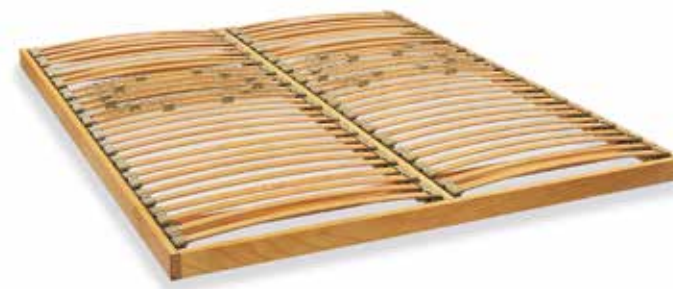
ART. 24 RETE IN APPOGGIO INTERAMENTE IN LEGNO