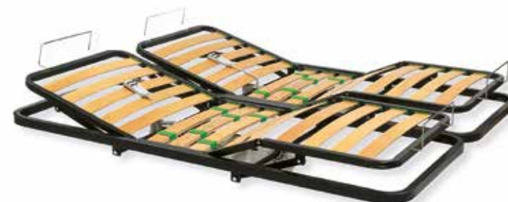
ART. 22 RETE IN APPOGGIO TELAIO IN FERRO E LISTELLI IN LEGNO CON MOTORE E ALZATE INDIPENDENTI